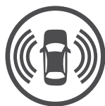
מערך בטיחות אקטיבית

הלב של ג'יפ גרנד צ'ירוקי Laredo הוא מנוע פנטאסטאר V6 בנפח 3.6 ל' אשר מפיק 295 כ"ס וכ-36 קג"מ. עם תיבת הילוכים בת 8 מהירויות והנעה כפולה יש לג'יפ יכולת דינאמית מלהיבה. יוקרה וטכנולוגיה מתקדמת נפגשות בתא הנוסעים. איכות החומרים היא מהשורה הראשונה, מושב הנהג מתכוונן חשמלית, גלגל הגה מצופה עור ומאפשר שליטה על מערכות הרכב השונות, גלגל הגה מצופה עור ומאפשר שליטה על הרכב השונות, מחשב דרך רב תפקודי בלוח המחוונים ומערכת מולטימדיה מתקדמת הכוללת ממשק מלא לסמארטפון. ואי אפשר בלי מערך בטיחות המגן על הדברים החשובים באמת - חיי האוהבים. 7 כריות אוויר ומערכת בטיחות אקטיבית.